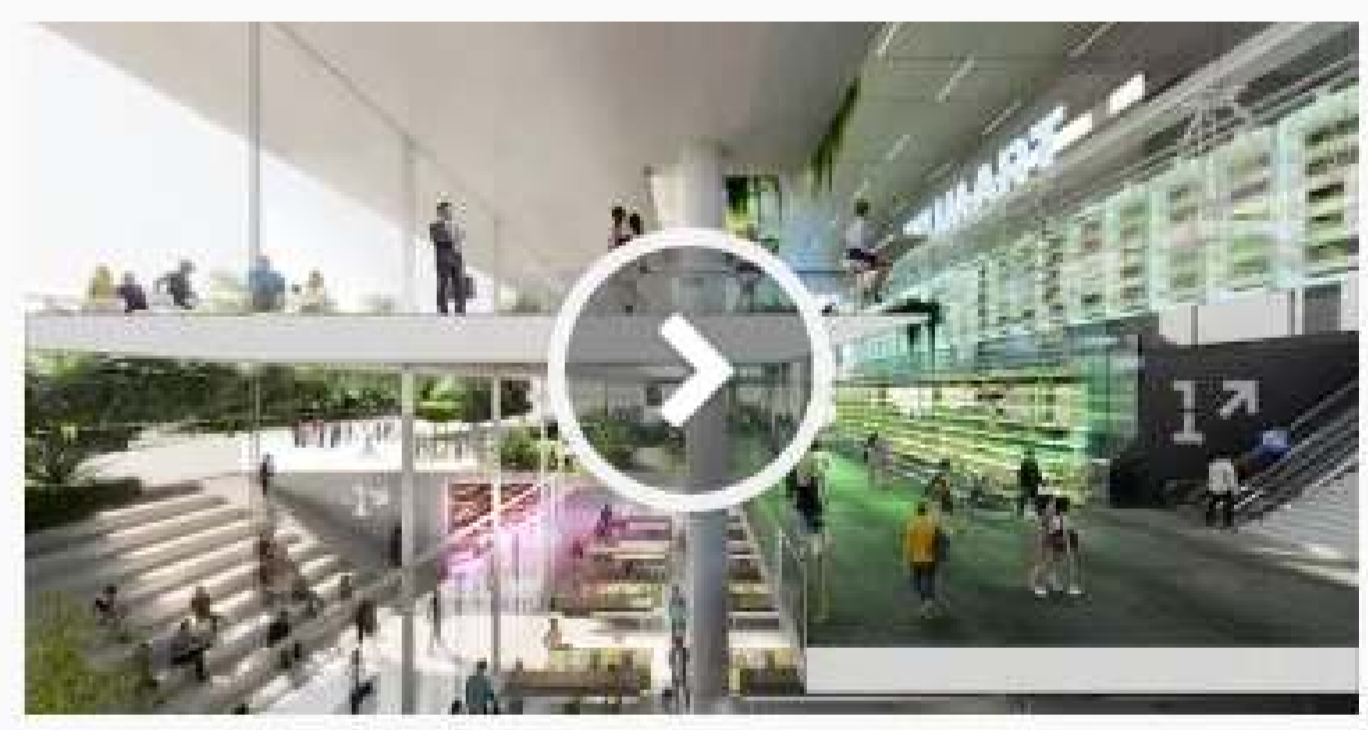
Jian Mu Tower: in Cina il grattacielo idroponico più alto al mondo