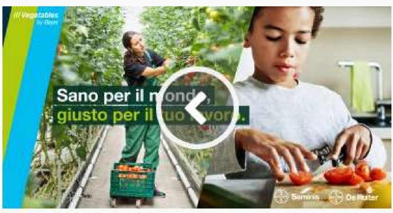
Bayer lancia la nuova piattaforma Vegetables