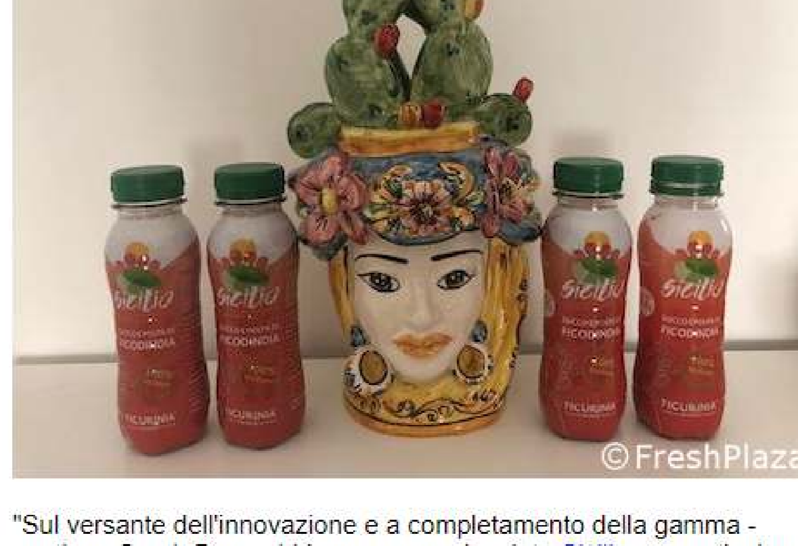
Sicilio juice bottles and a Sicilian woman figurine.