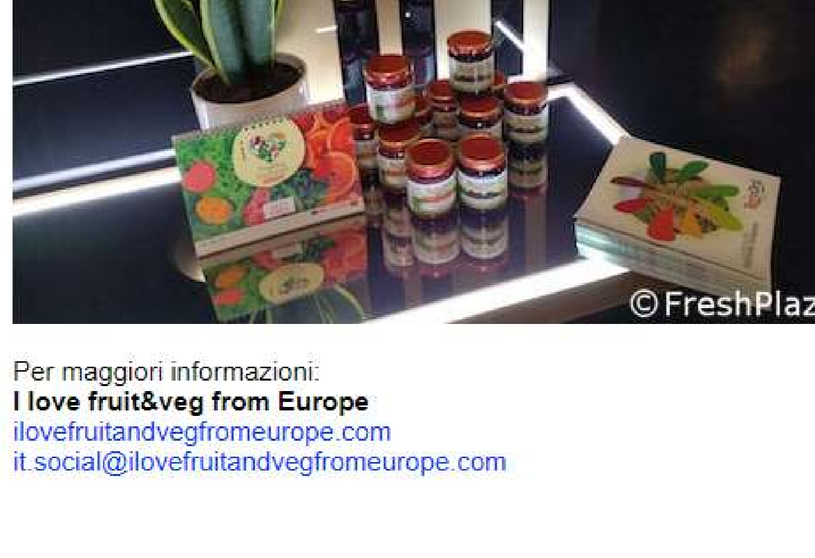
Sicilio juice bottles and a plant.