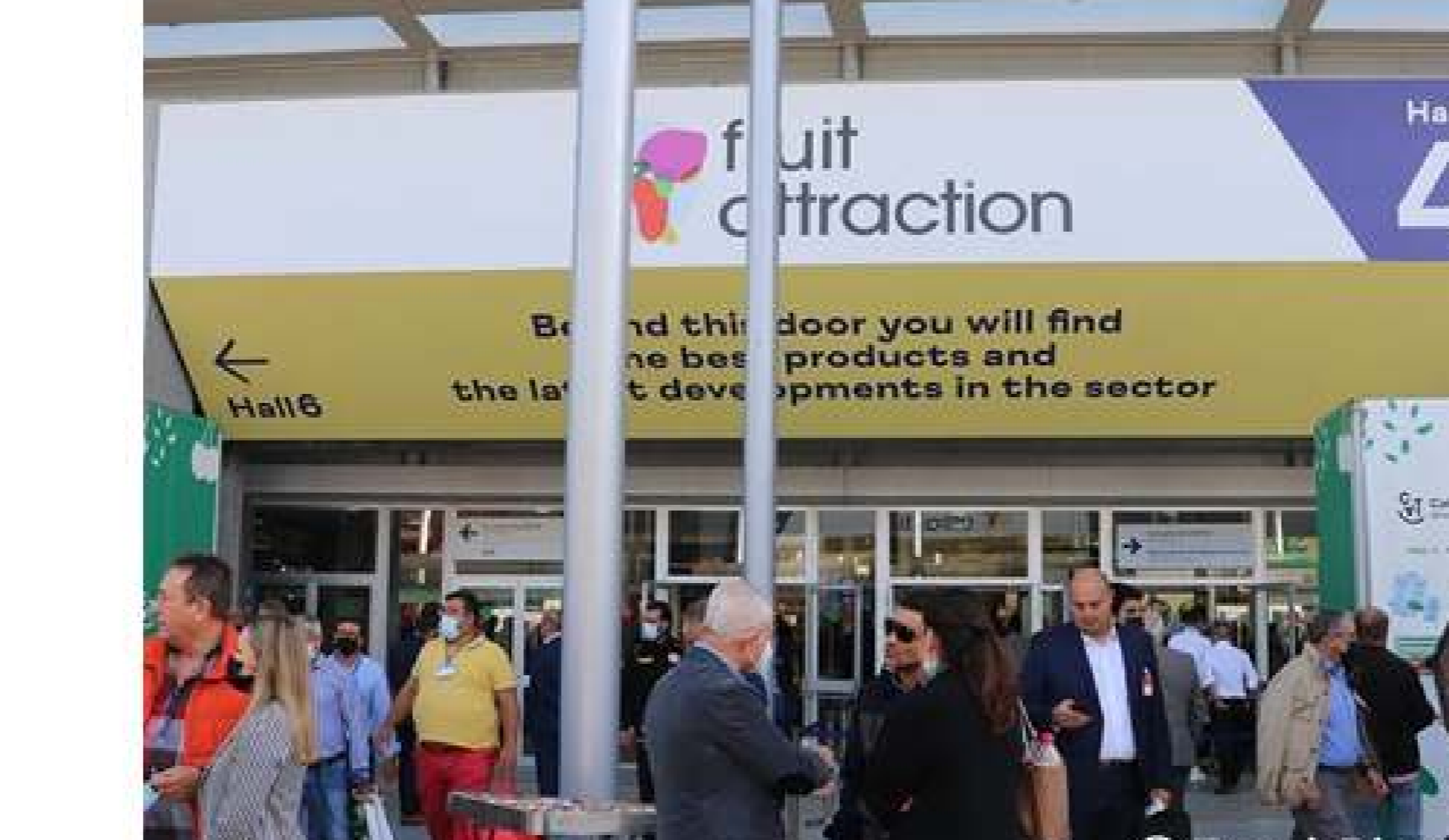
All'interno della Hall 4 vi erano la maggior parte degli espositori italiani di questa edizione.

Fruit Attraction, Italia sempre più protagonista dell'ortofrutta europea