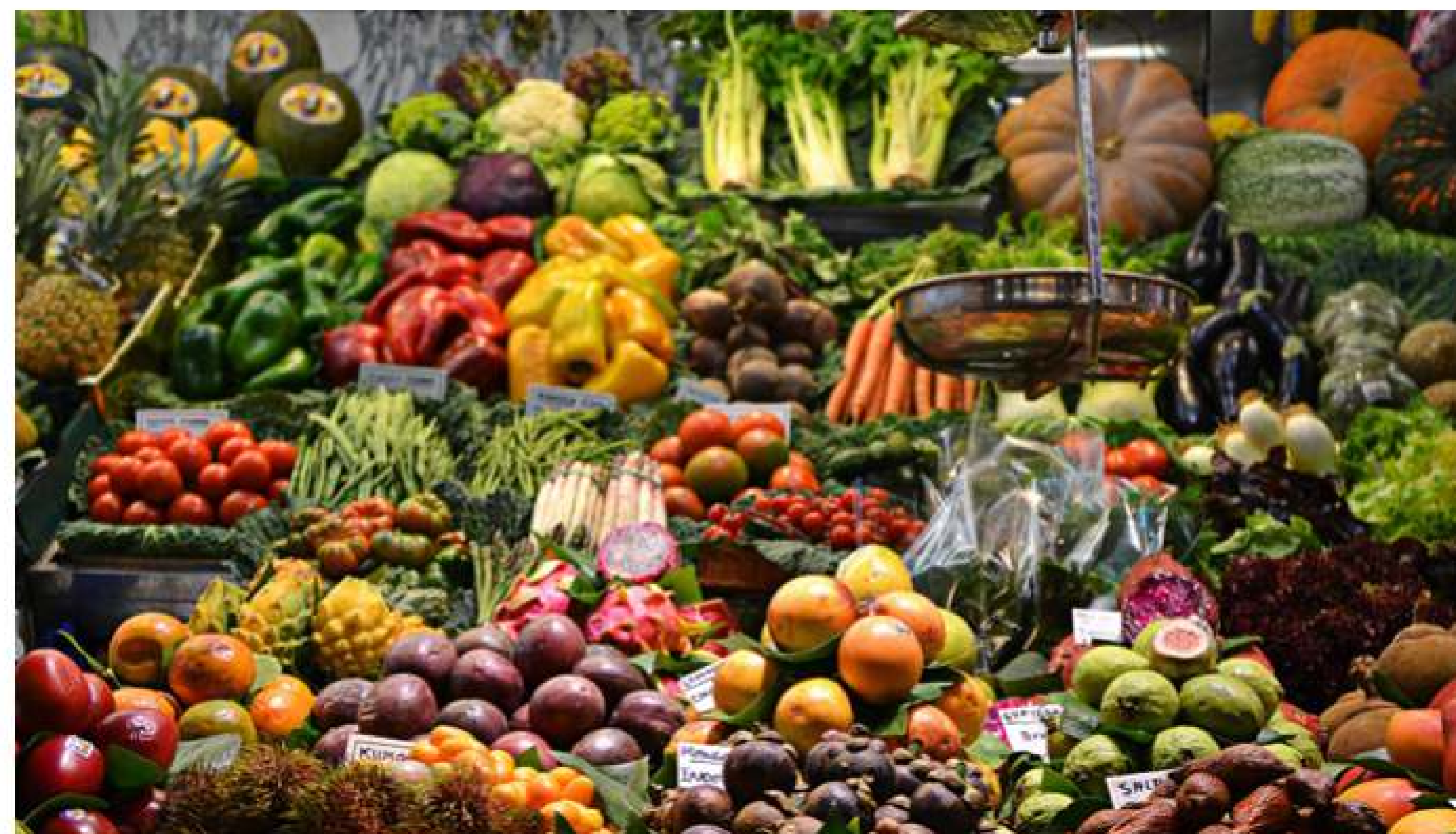
Die «I Love Fruit & Veg»-Kampagne will den Konsum von Obst und Gemüse fördern.