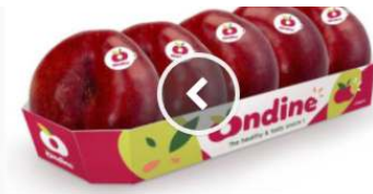
Naturitalia punta sull'innovazione varietale