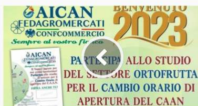
Ingrosso: a Napoli per l'orario diurno si coinvolgono i clienti