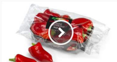
Apofruit Italia firma il tris a Marca 2023