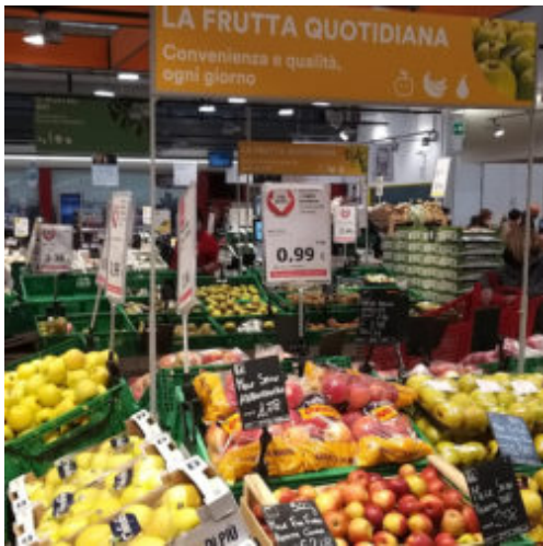
Rapporto Coop: la grande debacle di frutta e verdura 7 Settembre 2023