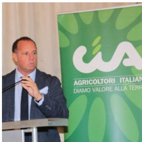
Nocciola Piemonte Igp: Cia chiede quotazioni differenziate 5 Settembre 2023