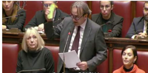
ATTUALITÀ Zuccina e pera in Aula, la protesta di Bonelli