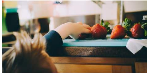
ATTUALITÀ Ortofrutta, quando i bambini ne consumano di più