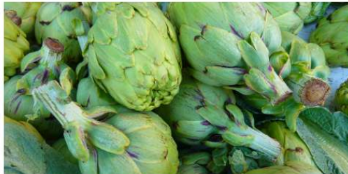
ATTUALITÀ Carciofi, 7 kg per comprare un caffè