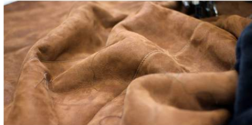
ATTUALITÀ Mele e mandarini diventano similpelle