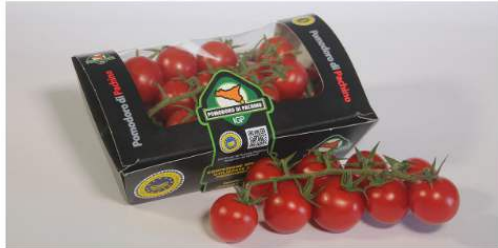
ATTUALITÀ Sicilia, il comparto ortofrutta unisce le forze