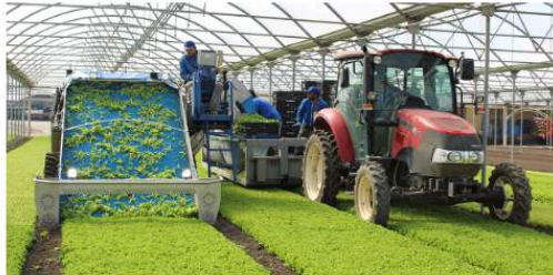
ATTUALITÀ La IV gamma e la sfida di filiera