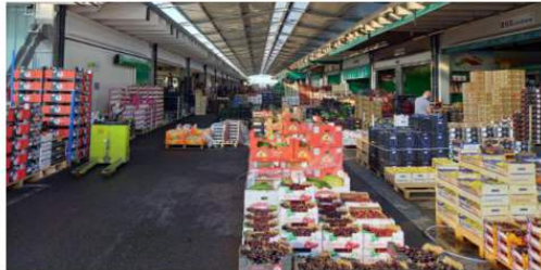
ATTUALITÀ Nei mercati all'ingrosso le feste non ci sono più