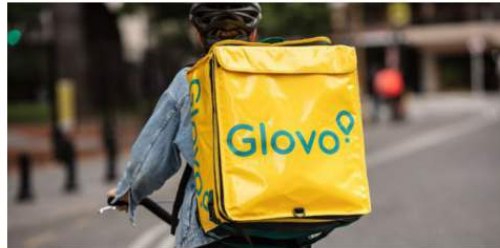
ATTUALITÀ Glovo, ordini record per l'ortofrutta: +287%