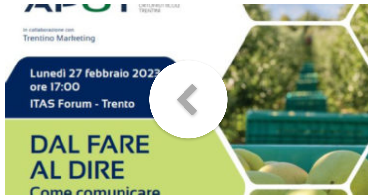
Ortofrutta: un convegno su come comunicare la sostenibilità