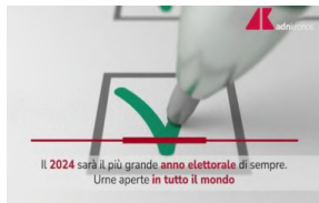
2024 anno con più elezioni di sempre