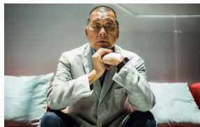
Hong Kong, Jimmy Lai a processo: si dichiara non colpevole