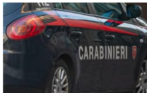
Napoli, donna uccisa da proiettile vagante a Capodanno:...