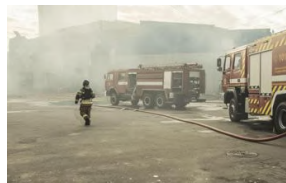
Ucraina, missili russi su Kiev: mancano acqua e luce