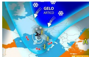
Meteo, si cambia: in arrivo ciclone dell'Epifania,...